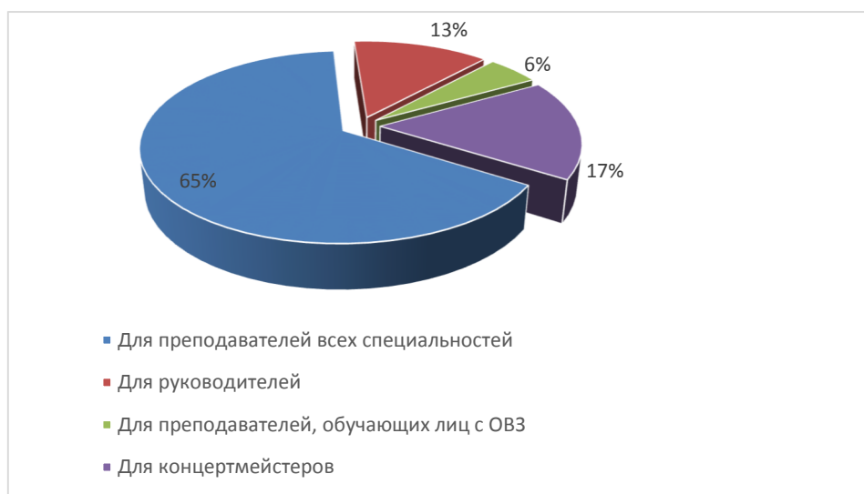
Диаграмма 1. Виды программ дополнительного профессионального образования

В процентном соотношении большее количество ДПП было реализовано для категории слушателей «преподаватели всех специальностей» и составило 65% от общего количества реализуемых в отчетный период программ, что значительно выше по сравнению с прошлым отчетным периодом (за период с 01.04.2020 по 31.03.2021 – 45%). В числе слушателей – преподаватели музыкальных отделений ДШИ, детских музыкальных школ; детских художественных школ и художественных отделений ДШИ. В сравнении с прошлым отчетным периодом выросла реализация дополнительных профессиональных программ для концертмейстеров ДШИ, колледжей искусств, за отчетный период она составила 17% (за период с 01.04.2020 по 31.03.2021 – 7%).