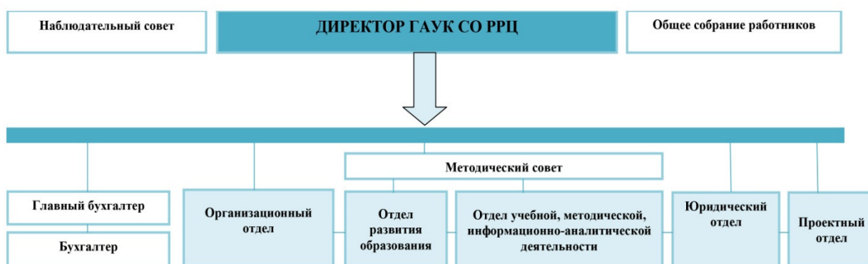
Структура государственного автономного учреждения культуры Свердловской области «Региональный ресурсный центр в сфере культуры и художественного образования»

Структура и органы управления организации представлены на Рисунке 1.