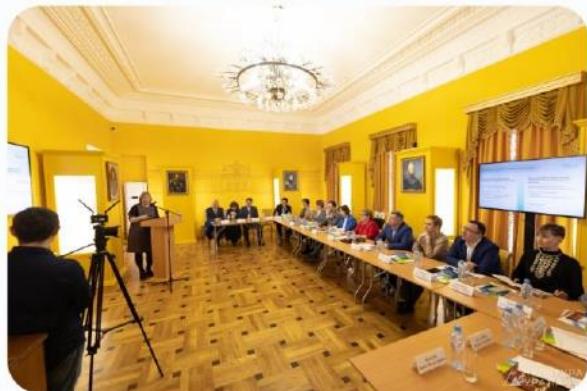
Презентация новой концепции РЦК на коллегии Минкультуры СО