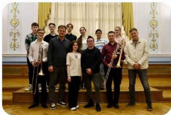
Стажировка артиста оркестра в Свердловской филармонии