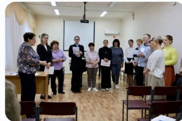
Стажировка будущего преподавателя ДШИ