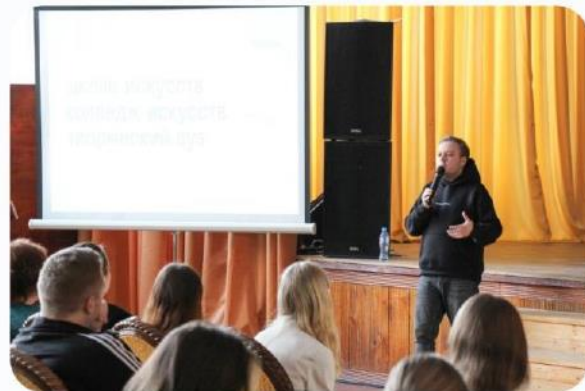
Презентация Центра карьеры в колледжах искусств региона