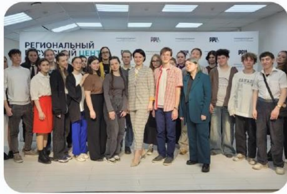
Проведение лекций для студентов ПОО сферы культуры